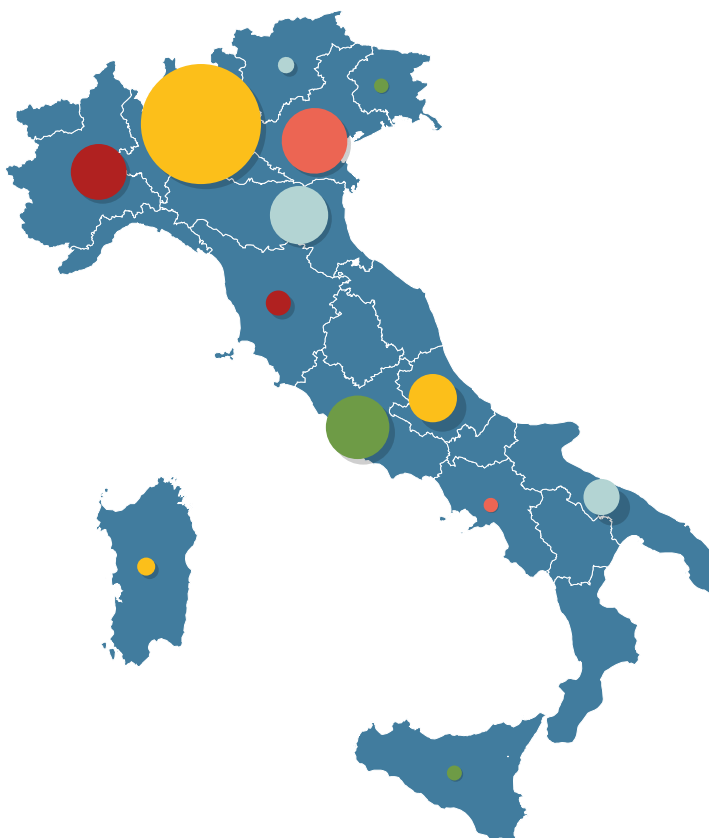
Fig. 4 - Distribuzione geografica delle 70 maggiori imprese attive nell'edilizia privata Elaborazione di Guamari su dati di bilancio 2023 e forniti dalle società